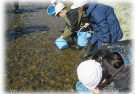
【ユビキタスな癒しの川づくり委員会】 【ふる里明治100の会】